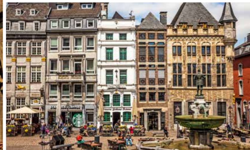
Het marktplein, met Brauhaus Goldener Schwan |