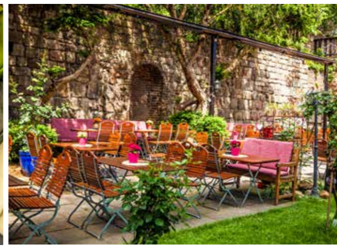
Tassenwinkel in Körbergasse | Bij Magellan is het goed eten voor weinig geld