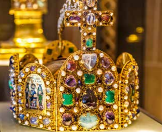
Gouden kroon in het raadhuis | Het oudste deel van de Dom werd gebouwd tussen 796 en 804 | Bij pub Postwagen hielden vroeger de postrijtuigen halt |