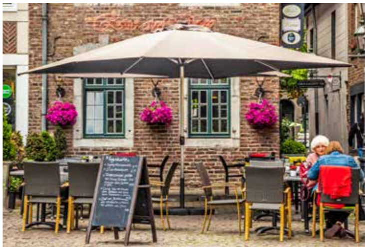
Bloemen en plantenwinkel Blütezeit, Fischmarkt | Schoenwinkel in de Körbergasse | Restaurant Rose am Dom, Fischmarkt