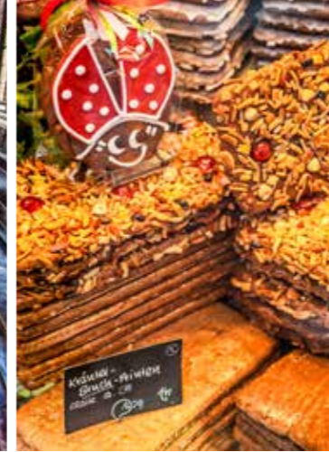
Overal zie je bakkerijen met Aachener Printen, gekruide peperkoeken