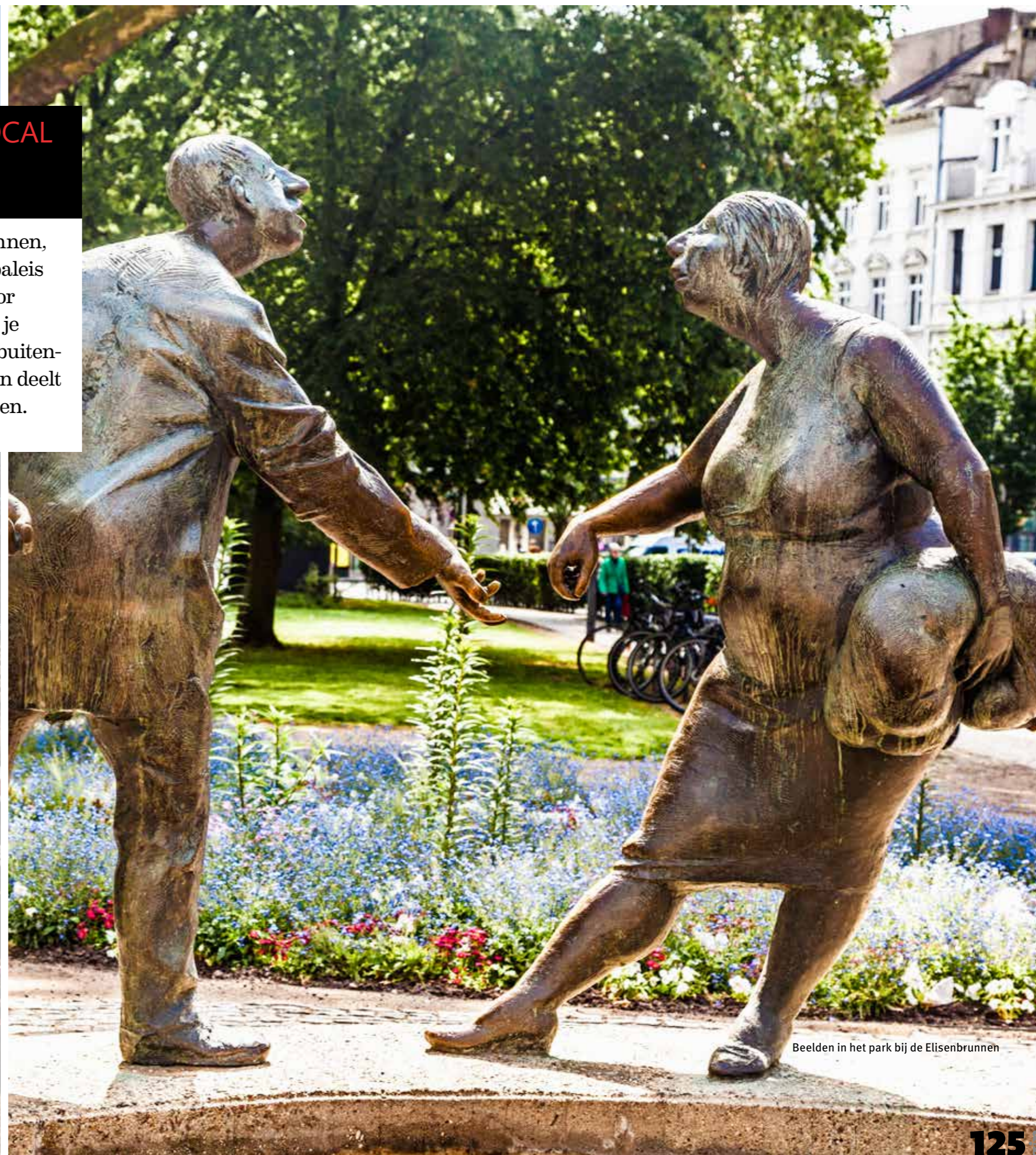
Beelden in het park bij de Elisenbrunnen