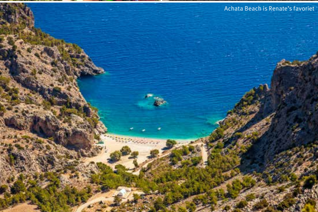
Achata Beach is Renate's favoriet