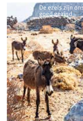
De ezels zijn ons goed gezind