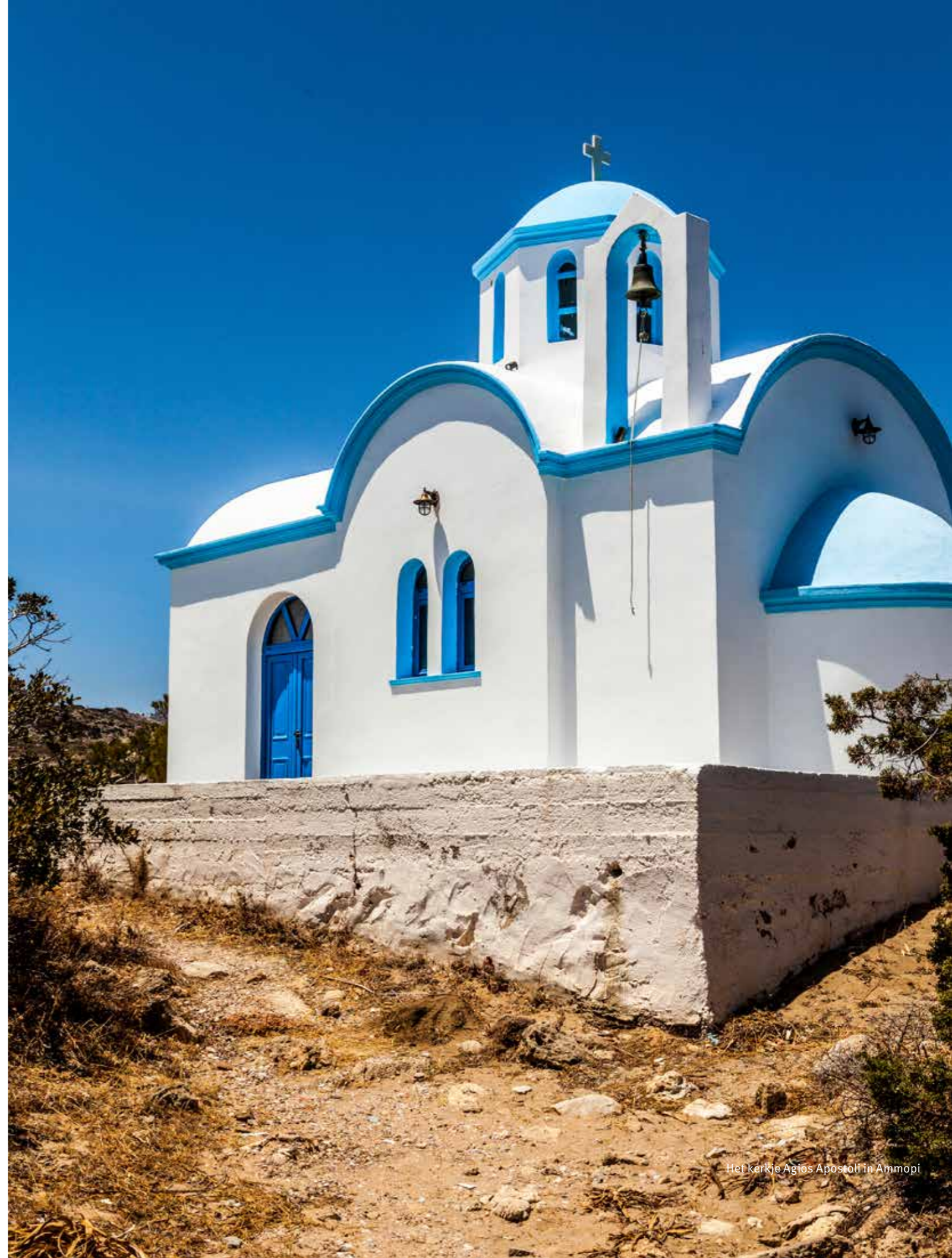
Het kerkje Agios Apostoli in Ammopi

Vanuit Pigadia maak ik die week meerdere wandelingen. Langs witte bergdorpjes, olijf- en wijngaarden, hier en daar een oude stávlo (stal). Door de beschutte vallei van Pigadia, en naar de boven op een berg gelegen kapel van Profitis Ilias, met geweldig uitzicht op Achata Beach. De prachtige Lastos hike voert door pijnbossen en biedt telkens weer een blik op de allerhoogste top van Kárpathos, de Kali Limni (1215 meter). Met een kustlijn van zo’n 160 kilometer is de blauwe zee altijd wel in beeld. De Meltemi, de harde tot stormachtige wind die vooral in de zomer over de Egeïsche Zee waait, doet zich ook deze week gelden. Zeker niet onaangenaam bij temperaturen van dik dertig graden. En ja, de geiten, ze zijn nooit ver weg. Zijn ze dat wel, dan is het geheid het gerinkel van hun bellen dat je tijdens de wandeling vergezelt. ■