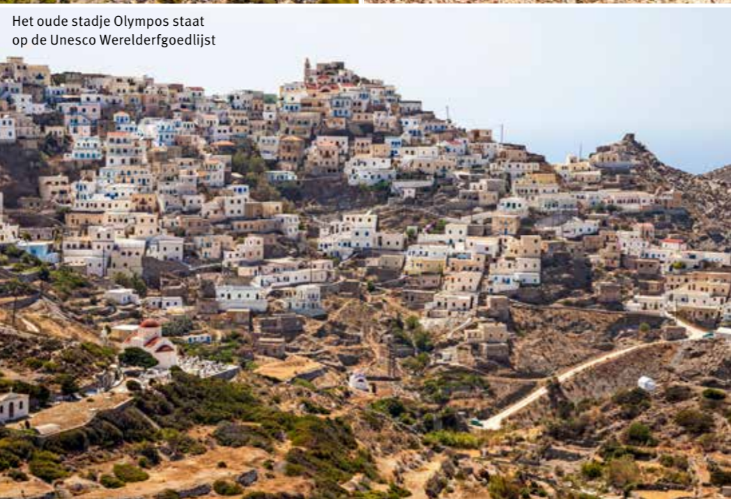
Het oude stadje Olympos staat op de Unesco Werelderfgoedlijst