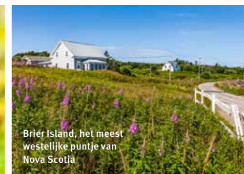
Brier Island, het meest westelijke puntje van Nova Scotia