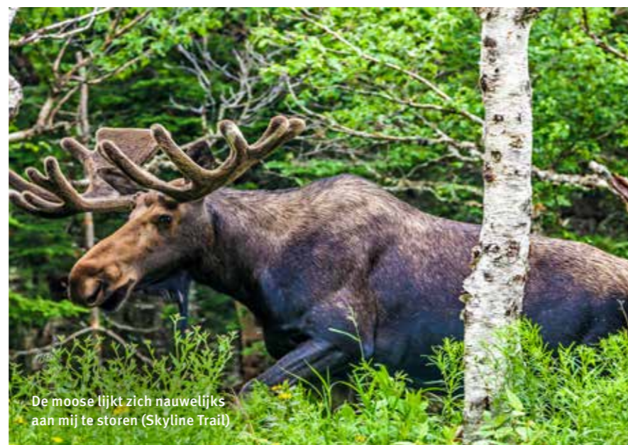
De moose lijkt zich nauwelijks aan mij te storen (Skyline Trail)

Er wordt beweerd dat stekelvarkens hun stekels afschieten, als de vijand te dicht nadert. Gelukkig hoor ik dit pas achteraf. Ik ben in Taylor Head Provincial Park, aan de Eastern Shore, voor een acht kilometer lange kustwandeling. Van heel dichtbij bewonder ik een stekelvarken dat zich traag waggelend uit de voeten maakt. Een enorm beest met vervaarlijk ogende stekels. Het blijkt echter een hardnekkig fabeltje. Zo'n stekel, dat is niets meer dan een dikke, spits toelopende haar die in de huid van een vijandig roofdier kan blijven vaststeken en vervolgens loslaat. De stekels groeien, net als gewone haren, daarna gewoon weer aan. Chipmunks – een klein soort eekhoorn met een zwart-wit gestreept ach-