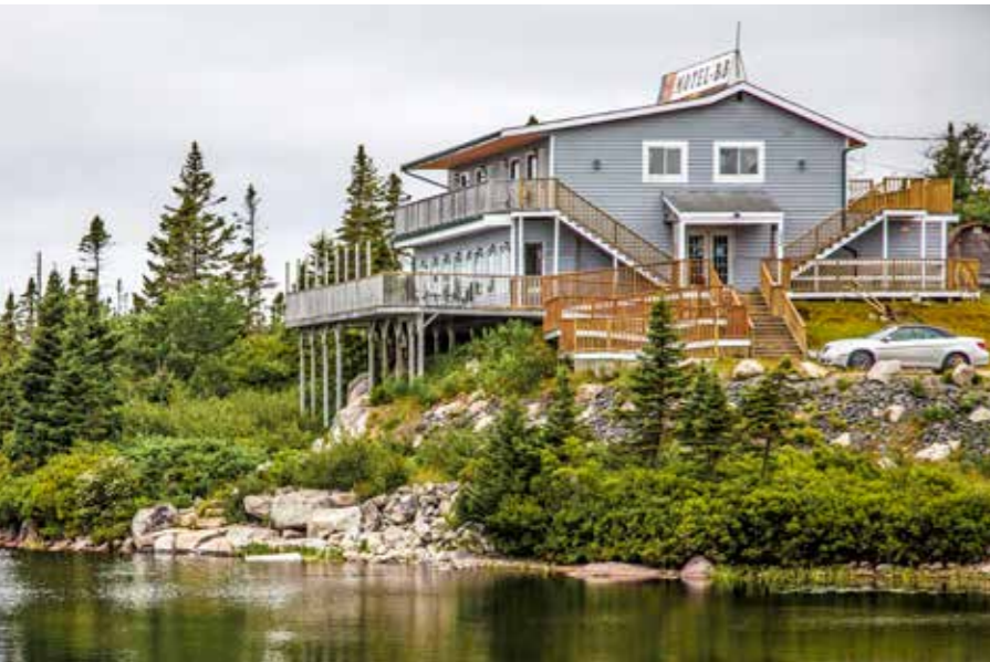
Majestueuze huizen en lieflijke B&B's vind je overal op Nova Scotia