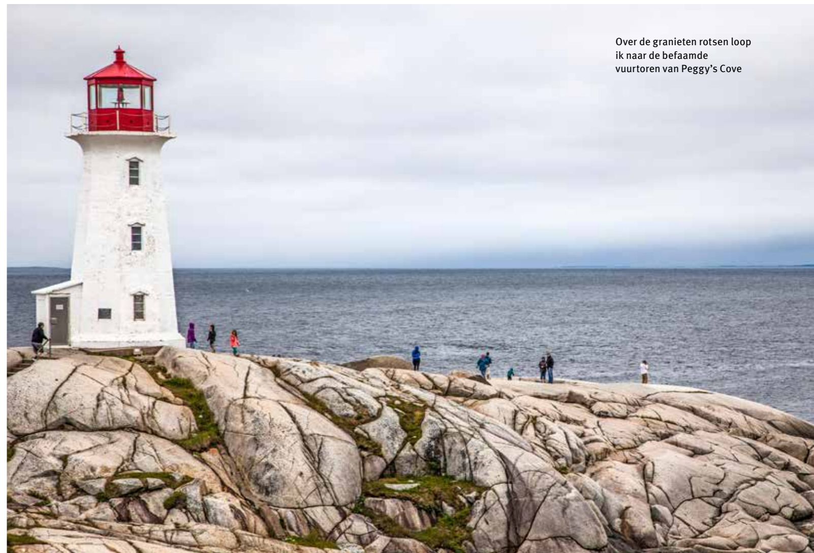
Over de granieten rotsen loop ik naar de befaamde vuurtoren van Peggy's Cove

De eerste blik op Cobequid Bay, een nauwe baai in het westen van Nova Scotia, is er een van opperste verbazing. Het water met de kleur en structuur van dikke chocolademelk, klotst tegen de oever op. Hier vind je 's werelds grootste getijdenverschillen, die kunnen oplopen tot zestien meter. Weldra zal het zeewater zich met maar liefst een foot (ca. 0,3 meter) per minuut weer terugtrekken. De vijf eilanden in Five Islands Provincial Park steken nu net boven het water ►