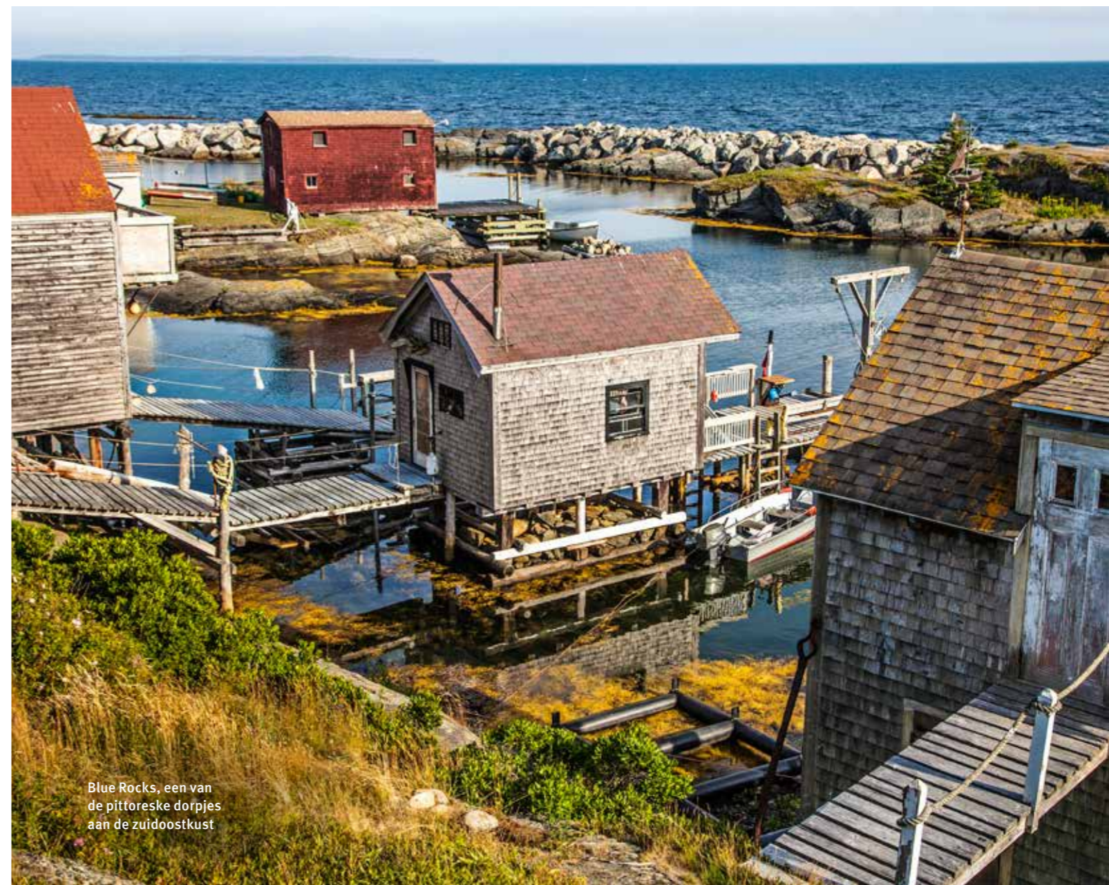
Blue Rocks, een van de pittoreske dorpjes aan de zuidoostkust