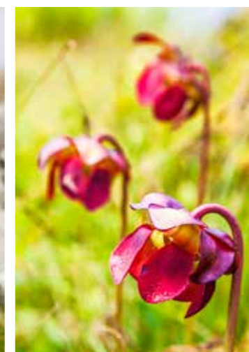
Rechts: Unieke vleesetende planten als de paarse trompetbekerplant (Taylor Head Provincial Park)